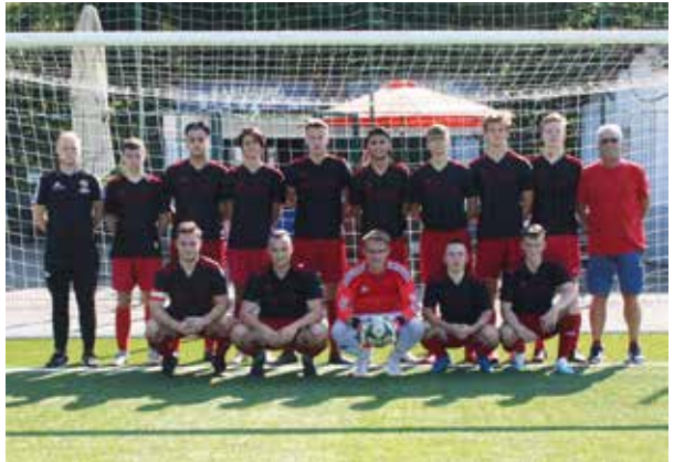
Die A-Jugend 2019/2020

Der Gegner aus Rehlingen begann druckvoll und nahm sogleich das Heft in die Hand. Doch unsere Jungs hielten dagegen, konnten sich nach und nach aus der Umklammerung befreien und den ein oder anderen Entlastungsangriff vortragen. Doch