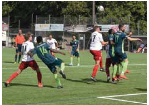
Gegen die DJK Neuweiler gab es für die FV 09-Zweite keinen Blumentopf zu gewinnen.